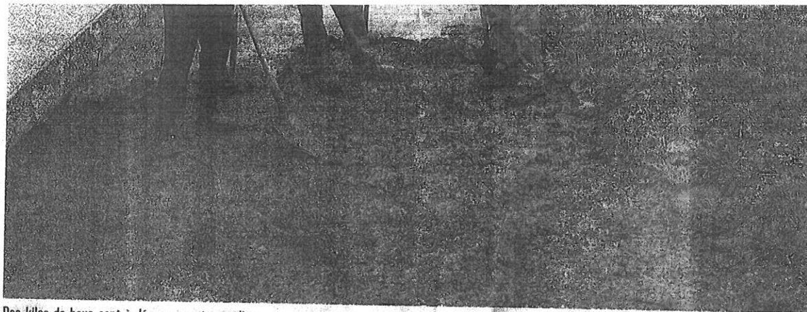
Des kilos de boue sont à dégager avant samedi.

À l'intérieur, trois femmes, elles aussi en stage à la Régie de quartier travaillent à rendre utilisable la salle des fêtes. Armée d'un chif-